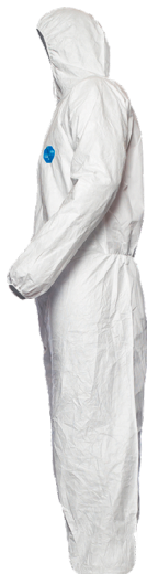
Traje protector DUPONT Tyvek 400